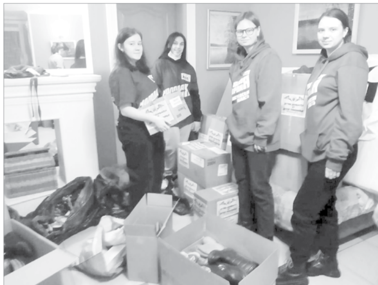
Гуманитарный груз сортировали и упаковывали на складе кафе «Свирь»