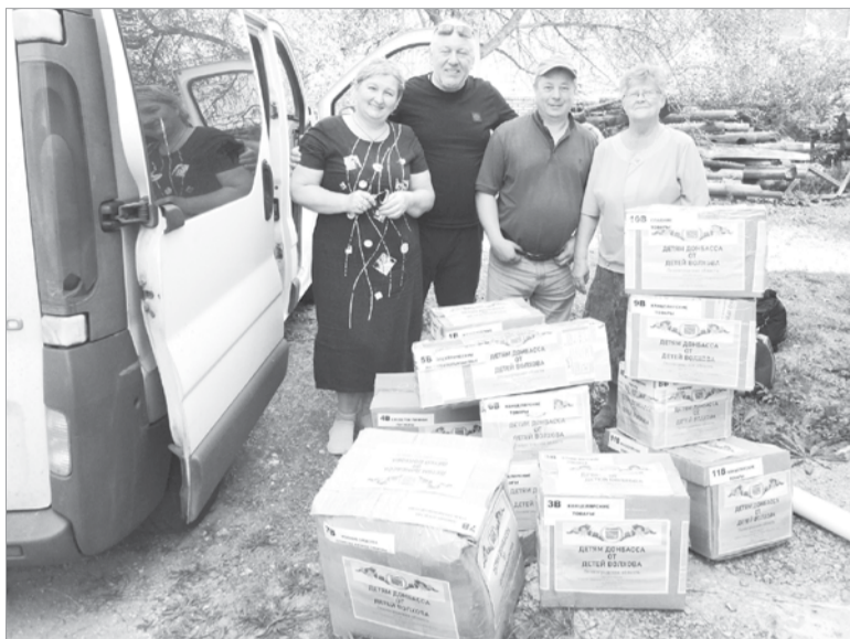
На приёмном пункте храма Нестора Летописца в Луганске