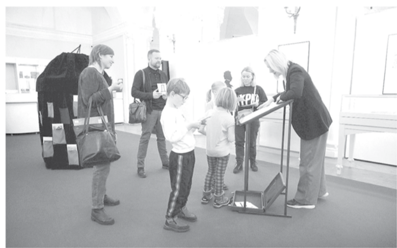
Каждый гость может оставить на выставке свое стихотворение