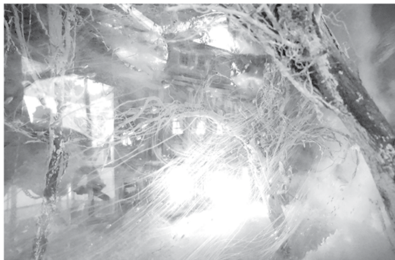
Миниатюрная инсталляция, спрятанная внутри «чемодана писателя»

В выставочном зале «Смольный» открылась детская интерактивная выставка под названием «Кто виноват? Пушкин!». Экспозиция ориентирована на детей — учащихся младших и средних классов. Вход для всех ребят — бесплатный.