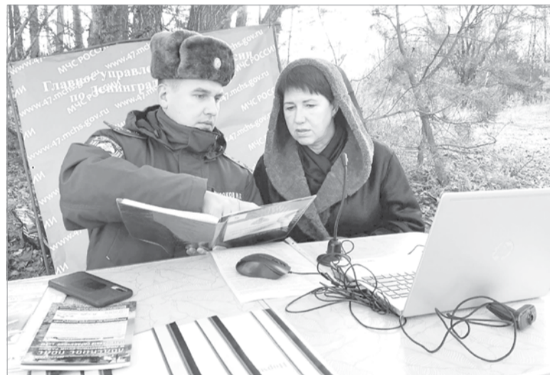
Для координации действий был создан оперативный штаб

Такие тренировки позволяют в условиях, приближенных к реальным, отработать действия всех служб, участвующих в спасении людей и ликвидации последствий чрезвычайных ситуаций.