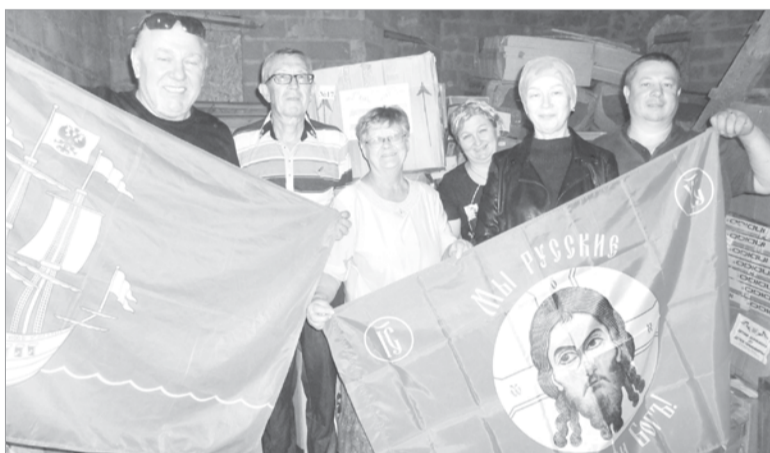
На складе храма после разгрузки гуманитарной помощи