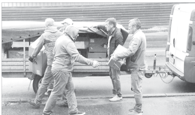
Команда добровольцев на погрузке автопоезда в г. Лодейное Поле