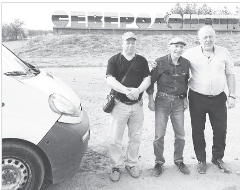
Прибыли в Северодонецк