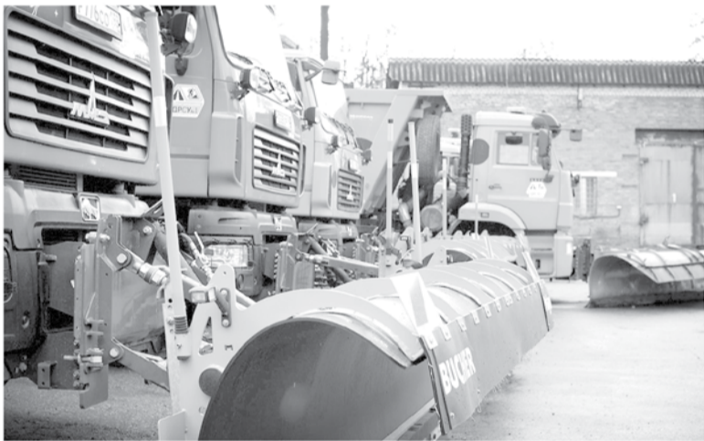
Около 500 единиц спецтехники выйдут на дороги Ленобласти этой зимой

К чести наших дорожников — они держали руку на пульсе и вовремя решали все сложные вопросы. Впрочем, это только первое испытание холодом в текущем году.